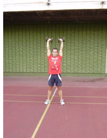
Slika 1: početni položaj