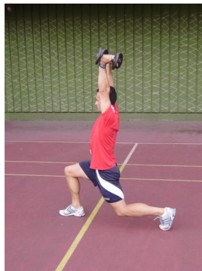
Slika 3: početni i završni položaj