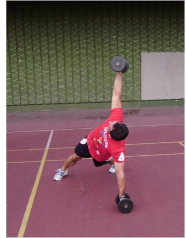
Slika 4b: završni položaj.

Spustite se u donji položaj skleka. Stražnjica utegnuta, ne dopustiti kukovima da propadaju, cijelo tijelo utegnuto. Ruke malo više od širine ramena. Nakon podizanja u gornji dio skleka, vršimo otklon trupa i podižemo bučicu iznad glave. Pogledom pratimo bučicu. Polako ju spuštamo natrag pa krećemo na drugu ruku. Kod otklona paziti da ne idemo previše jer možemo opteretiti mišice i tetive ramena. Kontrolirati pokret. Napraviti po 5 puta na svaku ruku.