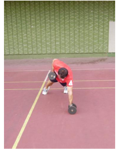
Slika 2: početni položaj