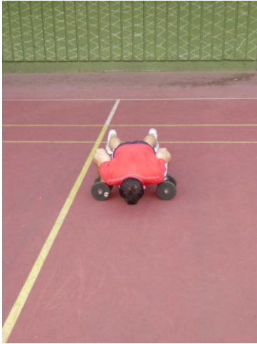
Slika 4: početni položaj