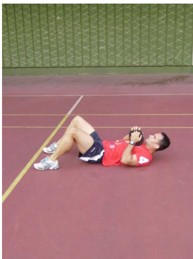
Slika 5: početni položaj